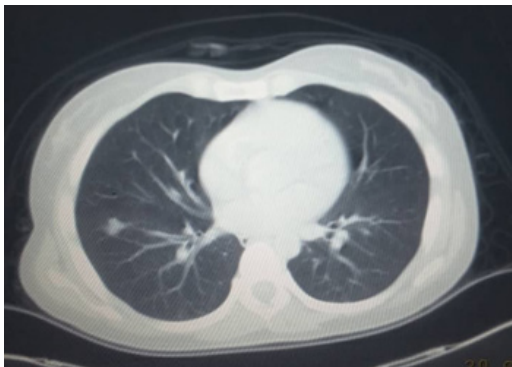
Figura 2. Tomografía Axial Computarizada simple de tórax. Imagen sugestiva de embolismo pulmonar

La paciente tuvo una evolución favorable y se decidió egresar a los 14 días con tratamiento con fraxiheparina, un vial de 0,6 unidades al día por vía subcutánea durante tres meses. Se mantiene evolucionando satisfactoriamente en su domicilio, sin manifestaciones respiratorias ni vasculares periféricas. El seguimiento periódico por ultrasonido del hematoma esplénico evidencia disminución del tamaño del mismo.