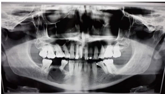
Figura 1. Radiografía panorámica que muestra lesión periapical en zona de bicúspide inferior derecha

Se realizó inicialmente radiografía periapical donde se observó una lesión grande en el periápice que involucraba la bicúspide y la zona donde se había hecho la extracción, posteriormente se realizó radiografía panorámica (Figura 1), y se apreció la lesión en mayor cuantía.