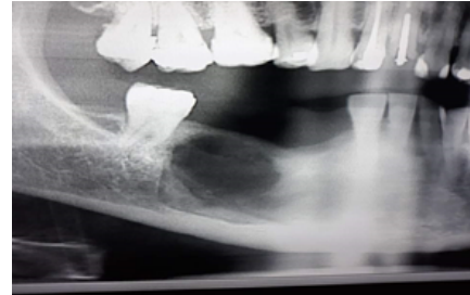
Figura 2. Radiografía panorámica que muestra zona afectada después de la primera intervención quirúrgica

Se realizó diagnóstico diferencial con un ameloblastoma. A seis meses de haber realizado la primera intervención quirúrgica el paciente muestra una evolución favorable (Figura 3).